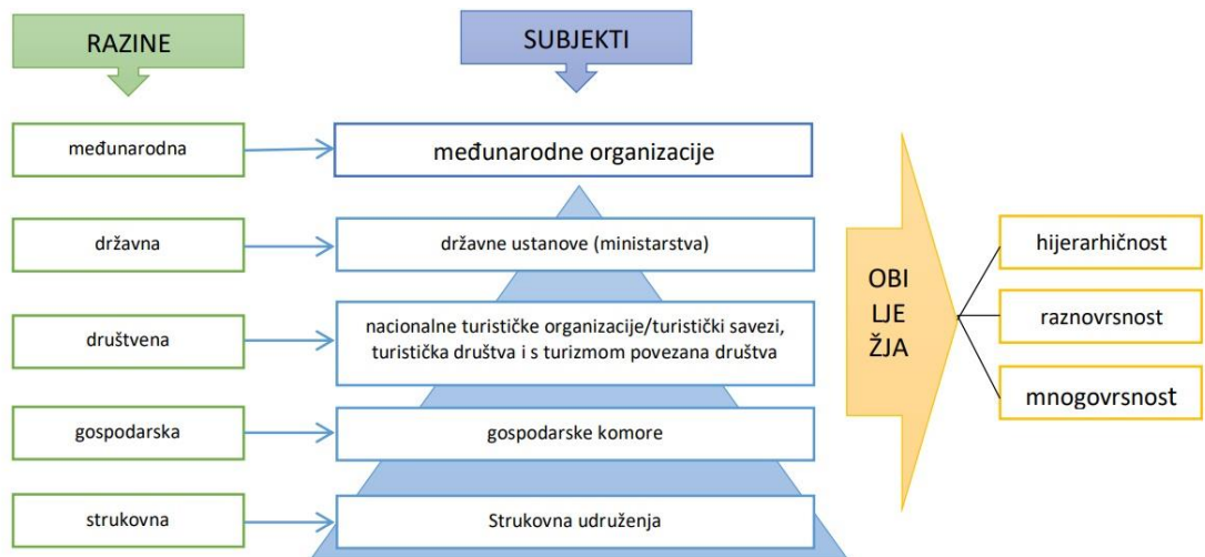
Slika 3.1 Razine, subjekti i obilježja turizma [2]

kroz pružanje turističkih sadržaja, također je i veoma bitan za pojedinca koji na taj način istražuje nove kulture i mjesta te zadovoljava svoju želju za putovanjem i odmorom. Aktivna uloga države ima veliku ulogu u ostvarivanju uspješnog turizma.