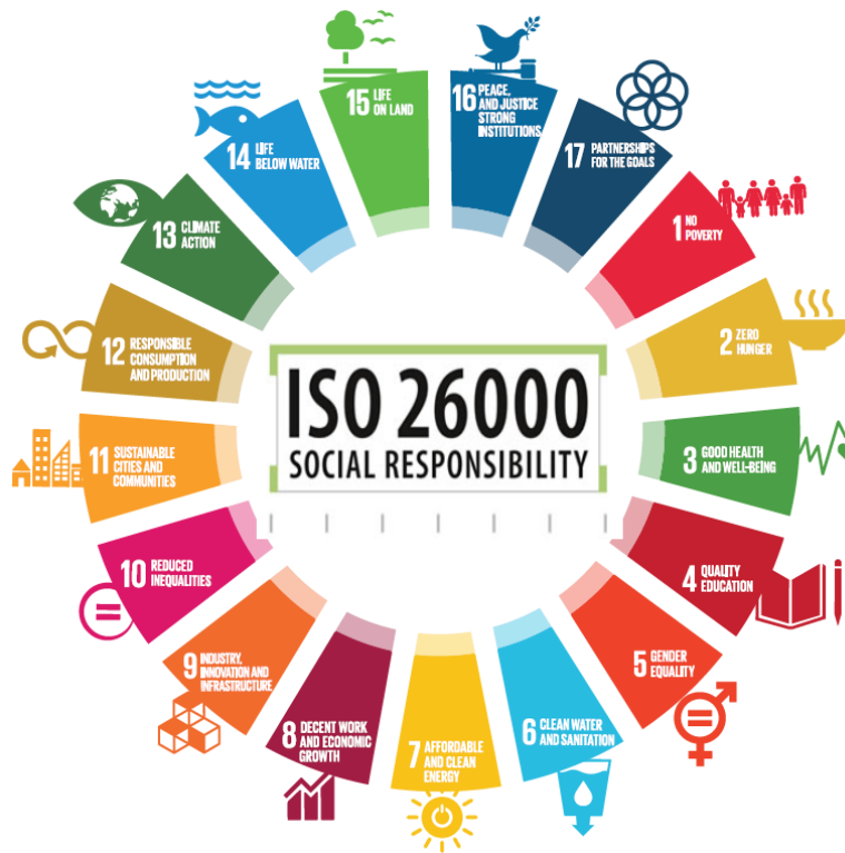
Slika 5.2 ISO 26000 [7]

Slika 5.2 prikazuje područja koja su obuhvaćena normama ISO 26000 te o kojima se vodi računa unutar njihovog područja djelovanja.