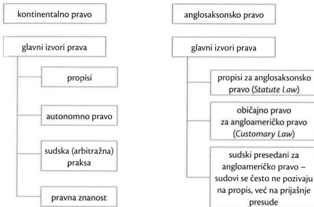
Slika 2.1 Izvori trgovačkog prava