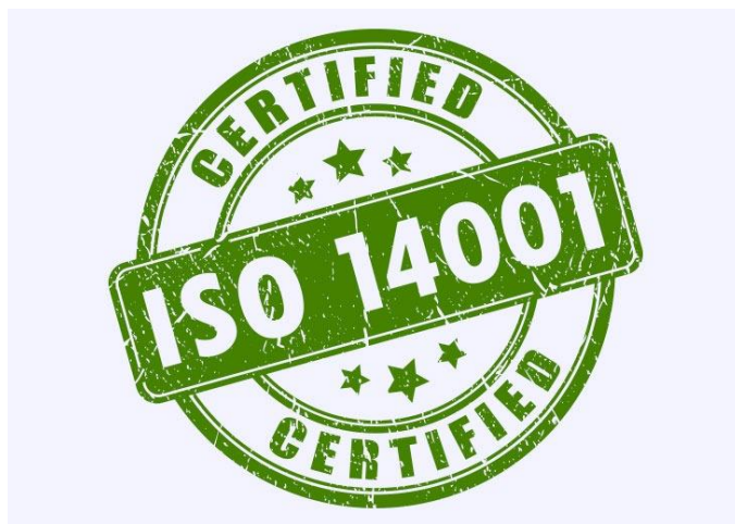
Slika 5.1 logo ISO 14001 [6]

ISO standard 14001 serija je standarda koji su opći te upravljaju okolišem tzv EMS ( Environmental management style ). Sustav uključuje upravljanje, strukturu, aktivno planiranje, postupke, procese i odgovornosti za održavanje i brigu o okolišu. Standardi navedene serije dostupni su za sve organizacije koje se njima žele voditi te po njihovim standardima i normama brinuti o okolišu. Također postoji i hrvatska norma ERN NE ISO 14001:2009 koja navodi i definira upravljanje okolišem te razvoj i organizaciju politike koja vodi računa o značajnim aspektima okolišta. Ukratko objašnjenje upravljanja okolišem uključivalo bi; smanjenje nepovoljnih utjecaja na okoliš, smanjenje vode i energije te usklađivanje vođenja poslovanja u skladu s zakonskim normama.