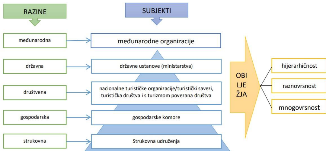
Slika 3.1 Razine, subjekti i obilježja turizma [2]

kroz pružanje turističkih sadržaja, također je i veoma bitan za pojedinca koji na taj način istražuje nove kulture i mjesta te zadovoljava svoju želju za putovanjem i odmorom. Aktivna uloga države ima veliku ulogu u ostvarivanju uspješnog turizma.