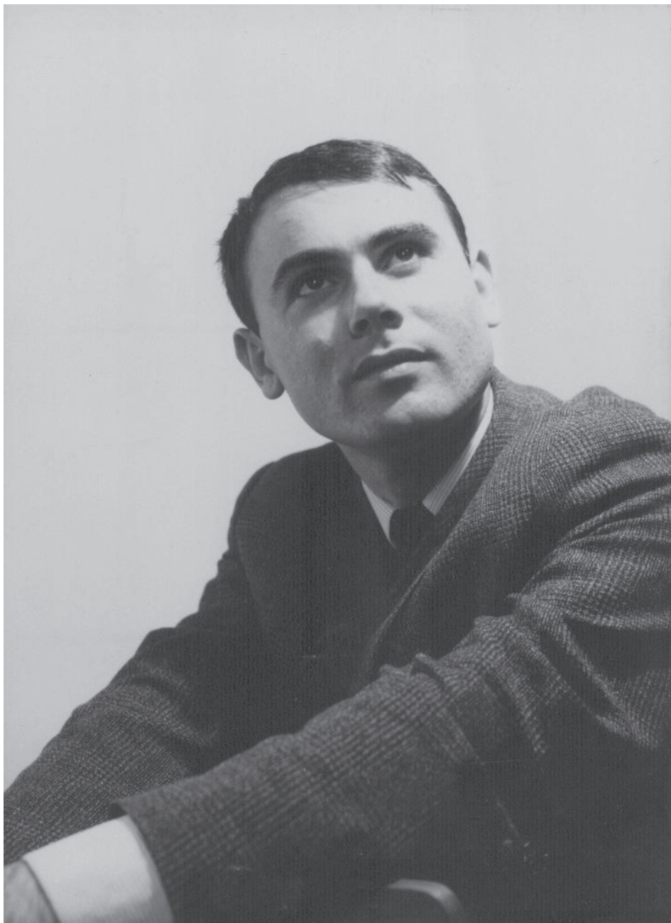
Valentin Benošić, pjesnik (9. veljače 1941. —29. svibnja 1968.)