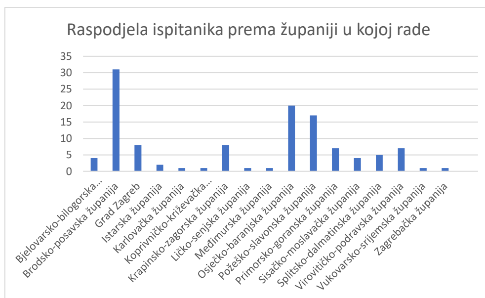
Graf 3 Raspodjela sudionika prema županiji u kojoj rade

Tablica 1 prikazuje da od ukupno 119 sudionika, 15 ih ima do pet godina radnog staža (12,6 %), 25 sudionika ima između 5 i 15 godina staža (21 %), 40 ih ima između 15 i 25 godina staža (33,6 %), dok 39 sudionika ima više od 25 godina staža (32,8 %).