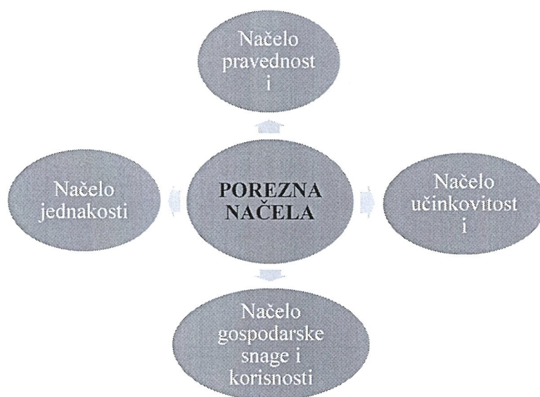
Slika 4.2. Načela suvremenog poreznog sustava [12]

Slika 4.2. pokazuje načela suvremenog poreznog sustava [1]