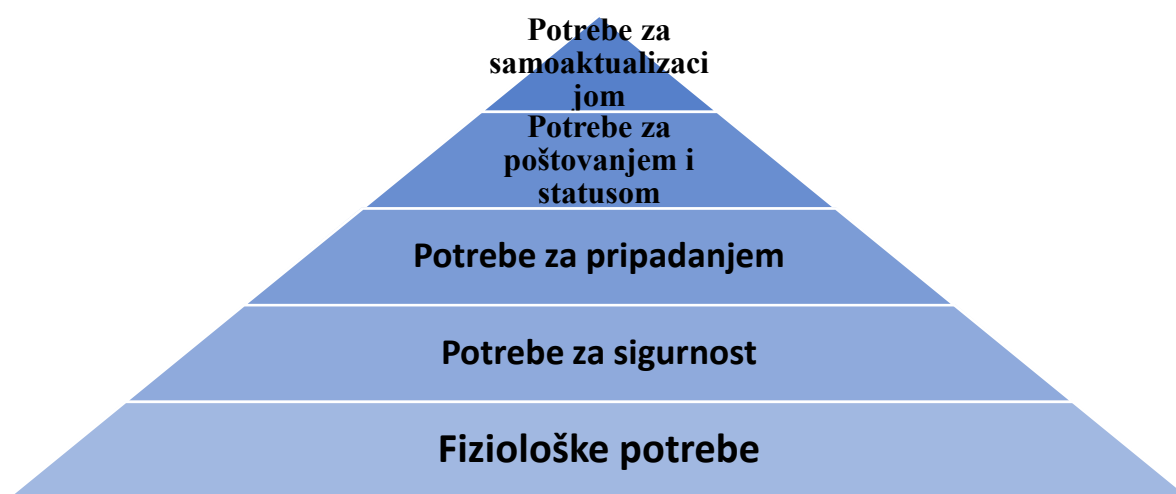
Slika 2.3.1. Maslowljeva hijerarhija organizacija potreba [15]

ćemo prebivati te što ćemo odjenuti. Također imamo i potrebu za sigurnošću gdje se želimo zaštititi od opasnosti kao što su vatre, oluje, poplave. Svako ljudsko biće kao i mi sami želimo da osjetimo da pripadamo negdje, i imamo socijale potrebe što znači da želimo biti prihvaćeni, želimo imati prijateljstvo, osjetiti sreću, ljubav. Ali prije svega želimo poštovanje, želimo reći s time da se uvaži naša stručnost i sposobnost. Te zadnje što se nalazi u hijerarhiji potreba je potreba za samoaktualizacijom. To nam govori kako mi želimo biti što jesmo, da želimo dosegnuti svoje granice, znanje, sposobnost i kreativnost. [2]